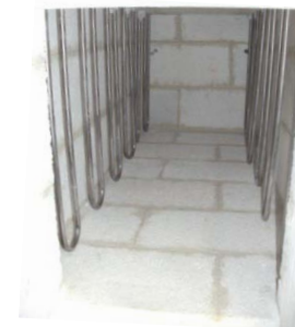
W heater 钨发热体 W - нагреватель Al 2 O 3 brick insulation 氧化铝砖炉衬 Al 2 O 3 кирпичная изоляция

Высокотемпературные печи для обжига/спекания фосфоров. T max до 2000 °C, 4 - 120 л объем камеры. Нагреватели: MoSi 2 , Mo, W, графит. Энергоэффективная изоляция: керамическое волокно, графитовый войлок или высокой чистоты Al 2 O 3 - кирпичи. С превосходной химической стойкостью и увеличенным сроком службы. В водородной среде со всеми функциями безопасности, конденсатор для отходящих газов.