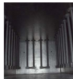
Graphite heater 石墨发热体 Графитовый нагреватель Graphite felt insulation 石墨毡炉衬 Изоляция из графитового войлока