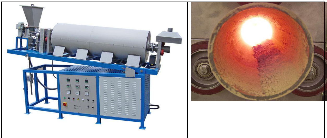
Bild 2. Drehrohrofen FDHK-3-150/1500/1200-S, 3-zonig Tmax 1200 °C, Rohr D = 150, beheizte Länge 1500 mm

Als Sonderbauform dienen Drehrohrofen zur stationären oder kontinuierlichen Behandlung von Schüttgütern, z. B. Pulver und Granulat. Durch die Drehbewegung des Rohres wird das Schüttgut gleichzeitig transportiert und durchmischt. Reaktionen z. B. beim Kalzinieren oder Reduzieren laufen dadurch gleichmäßiger, schneller und vollständiger ab als im Kammerofen. Nachgeschaltete Entsorgungseinrichtungen wie Nachverbrennung oder Wäscher können kleiner dimensioniert werden. Durch spezielle Dichtungssysteme mit Zwischenspülung können Drehrohrofen auch unter brennbaren Atmosphären betrieben werden. LINN HIGH THERM baut Drehrohrofen vom Minidrehrohrofen mit 150 mm beheizter Länge und 25 mm Durchmesser bis zum Produktionsofen mit 6 m Länge und 500 mm Durchmesser.