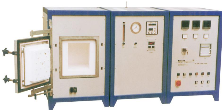
Bild 4 HT-1800 Plus G VAC, Hochtemperatur Vakuumofen, Tmax 1820 °, Kammervolumen 26 dm 3 , Vakuum bis 10 -3 mbar, Schutzgase: N 2 ,Ar

Optional kann zwischen verschiedenen Vakuumpumpständen, Begasungsanlagen, Abfackelung und Sicherheitseinrichtungen für den Betrieb mit explosiven Gasen gewählt werden. Durch den Einsatz moderner Regler mit SPS Ausstattung lassen sich alle notwendigen Schaltfunktionen automatisieren. Durch großzügige Leistungsauslegung und die Doppelkammerkonstruktion lassen sich schnelle Aufheiz- und Abkühlraten erzielen.