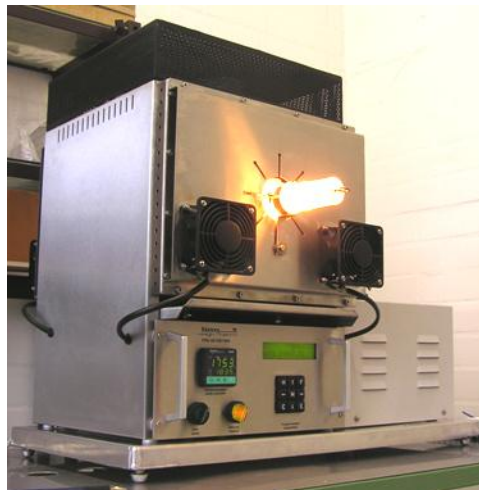
Bild 1 Hochtemperaturrohröfen KRISPE, Tmax 1840 °C, Saphireinsatzrohr, Kanthal Super 1900 Heizer

Einsatzrohre können aus Metall, Quarzglas/Quarzgut, Keramik oder Saphir bestehen.