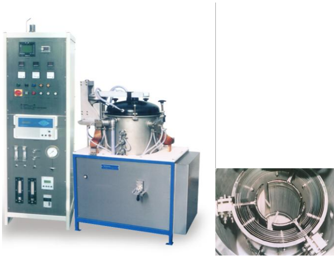
Bild 5 KKV 180/280/2300, Hochtemperatur Vakuumofen ,Wolframmaschenheizer, Isolation: Strahlungsbleche Wolfram,Molybdän, Tmax. 2300 °C, Kammervolumen 7,1 dm 3 , Vakuum bis 10 -5 mbar, Schutzgase: N 2 , Ar,H 2

Die extremen Eigenschaften dieser Öfen werden jedoch mit hohen Wärmeverlusten und Kühlwasserverbrauch erkauft. Dennoch, der Trend im Ofenbau heißt immer energieeffizienter, platzsparender und schneller. Die Entwicklung neuer, besserer Materialien ist dafür erforderlich. Es braucht aber auch innovationsfreudige Ofenbauer, welche die neuen, meist teureren Materialien zum Einsatz bringen und Kunden die bereit sind, für Verbesserungen auch zu zahlen. Der Laborofenbau mit vergleichsweise geringen Materialeinsatz sollte dabei eine Vorreiterrolle spielen.