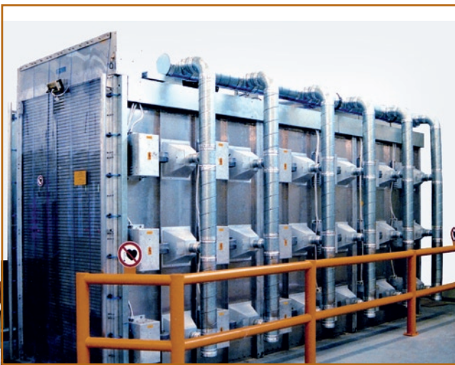
Abb. 3: Im Mikrowellenkammer Trockner kann man weniger toxische Flüssigabfälle in passenden Kunststoffbehältern eindampfen.