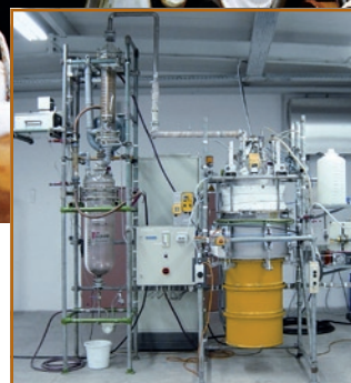
Abb. 1: Die Ergebnisse der Tests mit der Technikumsanlage dienen als Grundlage für die Dimensionierung und Auslegung einer kompakten und serienreifen Anlage.

werden. Darüber hinaus ist die Anlage so kompakt gebaut, dass man sie in einem Cargo-Container installieren kann. Somit bietet sie ein hohes Maß an Mobilität. Der Anwender kann den organisatorisch und finanziell aufwendigen Transport der gefährlichen Flüssigabfälle einsparen. Die gesamte Anlage wird einfach an den Entstehungsort der Flüssigabfälle transportiert. Ein optionales Stromaggregat erlaubt den autarken Anlagenbetrieb.